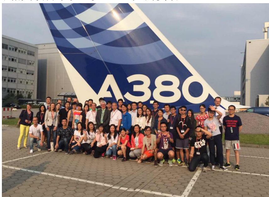
研究生在德国基地海外创新创业实践活动中参观德国波音公司

学校海外实践教学平台是“社会实践营”的重要依托。每年选拔研究生赴德国、新西兰、意大利等地进行社会实践，并对符合条件的研究生参加相关项目予以至少 5000 元的资助。