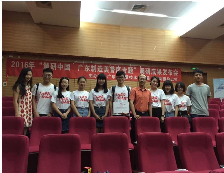
研究生暑期社会实践代表队获广东省质监局“调研中国”项目立项

业特色和就业创业核心竞争力培养，组织学校研究生到全省各地和部分省外地区广泛开展理论政策宣讲、科普宣传、文化传播、社会考察、社会调查、学术调研、公益服务、支教助学、法律援助、就业创业、见习实习等活动。党委研究生工作部每年根据当年的实践主题，组建一支校级示范社会实践团队。