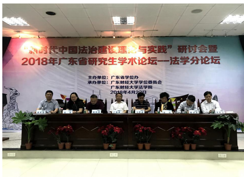
广东省研究生学术论坛——法学分论坛

“热点聚汇”主题学术沙龙结合社会、经济热点问题，改变传统学术活动台上讲台下听的被动接收信息的方式，采取面对面、开放式、主动参与的形式，每期由研究生选择自身所关注的热点主题。“热点