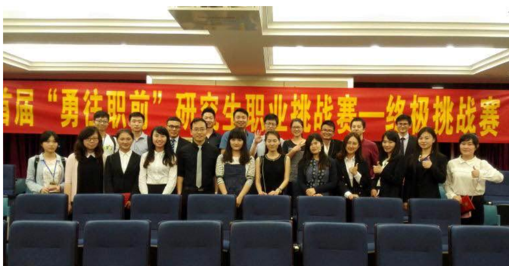
“勇往‘职’前”选手们经历了HR扣人心弦的提问享受终极挑战胜利的喜悦

“勇往‘职’前”职业挑战赛每年举办一次，挑战赛采取用人单位联合面试的形式，通过对赛制的合理设计，提升研究生的职业胜任能力，为优秀的研究生提供实习机会，也为用人单位选拔优秀人才，搭建校企联动的新桥梁。