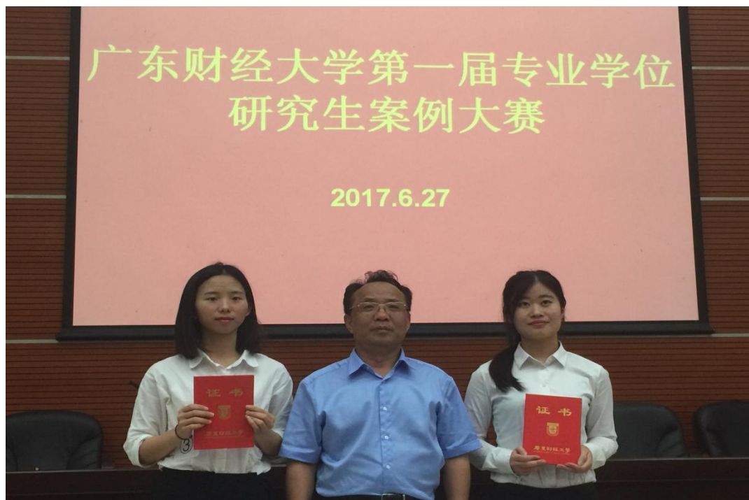
于海峰校长为首届校级专业学位研究生案例大赛获奖同学颁奖

“勇往‘职’前”职业挑战赛每年举办一次，挑战赛采取用人单位联合面试的形式，通过对赛制的合理设计，提升研究生的职业胜任能力，为优秀的研究生提供实习机会，也为用人单位选拔优秀人才，搭建校企联动的新桥梁。