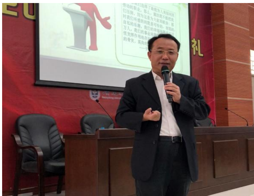
于海峰校长在青年骨干训练营和研究生谈理想信念与责任担当