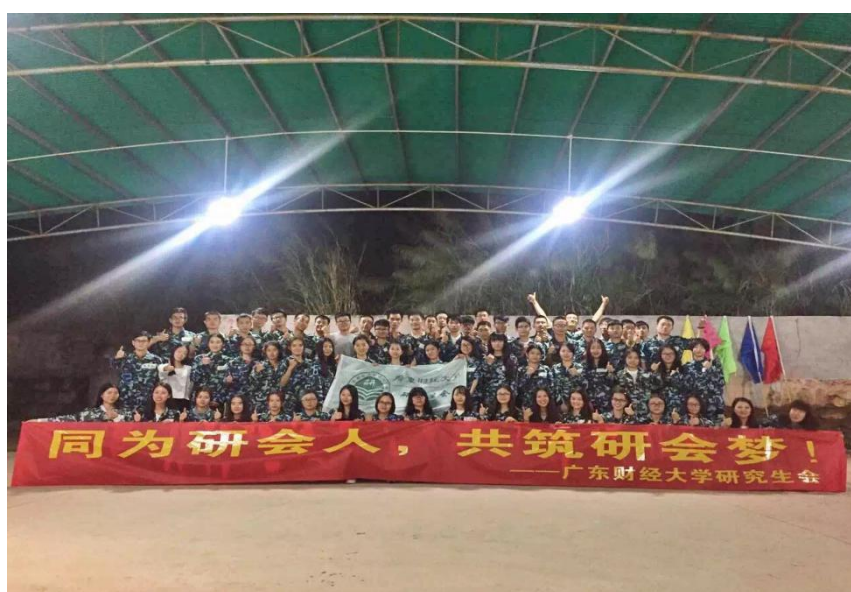
青年骨干训练营之素质拓展，提升研究生团队协作能力

学术创新营。 学术创新营活动的设计重在启发、引导研究生关注热点，培养研究生敏锐的学术触角，善于发现问题、研究问题、解决问题，以培养研究生学术素养、提升研究生学术创新能力为目标，以“全国研究生创新实践系列活动”、广东省研究生暑期学校、广东省研究生学术论坛、“热点聚汇”主题学术沙龙等活动为载体具体实施。