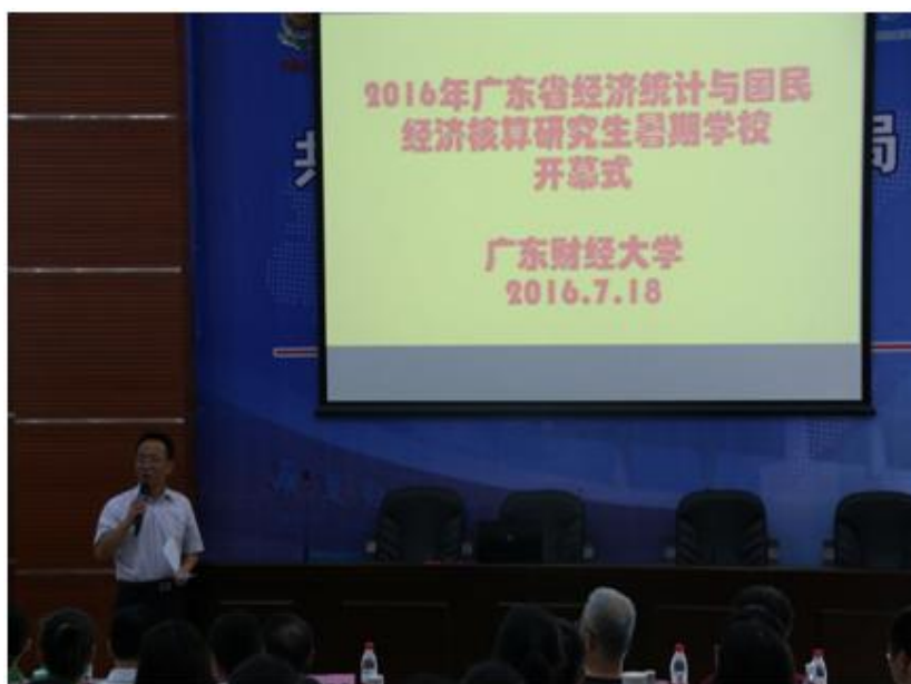
广东省经济统计与国民经济核算研究生暑期学校

学校每年主办 3-5 个广东省研究生暑期学校、广东省研究生学术论坛，学术大咖云集，吸引海内外高校的硕士生、博士生及青年教师参加，实现了学术争鸣和交流，为在校研究生营造了良好的学术氛围。