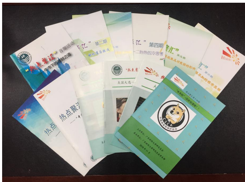
“热点聚汇”主题学术沙龙活动已成为深受研究生喜爱的品牌活动

“聚汇”学术沙龙每年举办 6-7 期。每一期活动后及时推出主题小册子，收集与本期主题相关的专业信息、活动参与者的精辟观点、高质量的小论文等。每期活动过后，以主题为纽带，由研究生自发组成相关主题的社团。